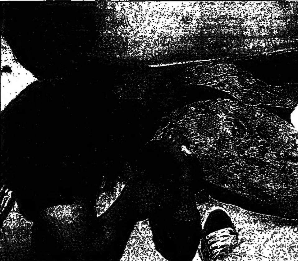
دانيا ديش اثيرت في ارض للحكوة الاسرائيلية لدى سملها قرار استمواز احتلالها (رويتر)